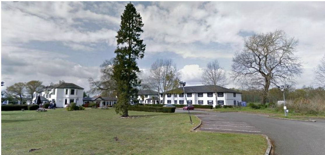
Fairmile Hotel und Gaststätte.