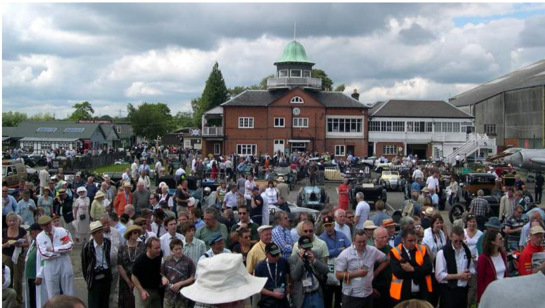
The Paddock Brooklands